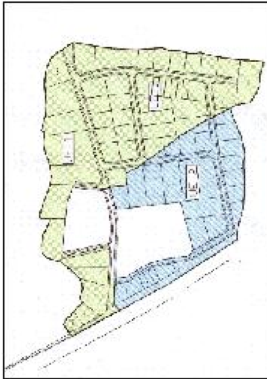
Plano de unidades de ejecución

propiedad del Ayuntamiento, cuenta con la parcelación de 32 parcelas de distintas dimensiones, la planificación de los viales y la dotación del sistema de abastecimiento de agua-alcantarillado y la dotación de las tomas de energía eléctrica, así como el alumbrado.