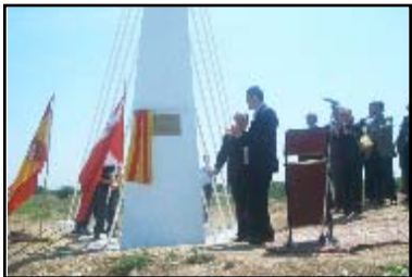
Inauguración del Polígono El Zafranar

La principal baza de este polígono es una completa infraestructura, así como un gran enclave geográfico que hacen que Mallén sea un pueblo con mucho futuro, y lejos de disminuir su población, cada día esta va aumentando.