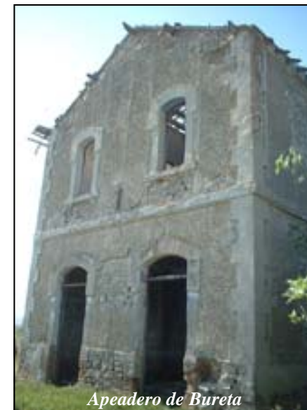
Apeadero de Bureta

El resto de la antigua Línea ha desaparecido al ser integrada en las fincas agrícolas. Se pueden seguir los 8 km. que faltan hasta Cortes, pasando por Mallén, usando rutas alternativas por los caminos vecinales; en nuestro caso, un camino muy adecuado es el de Magallón, que pasa por la cercanía de los montes de Burrén y Burrena. En Mallén, el antiguo apeadero estaba situado en lo que hoy es la calle Sauce.