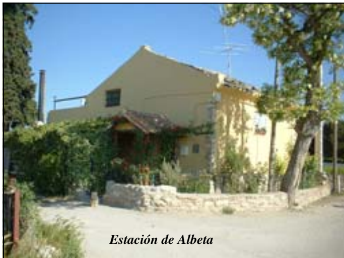
Estación de Albeta

Reconvertida en vivienda privada, está situada a las afueras del pueblo.