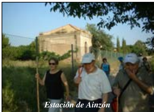
Estación de Ainzón

El nombre genérico que se les ha dado a estas antiguas infraestructuras ferroviarias es el de Vías Verdes, y en el caso del Campo de Borja ha quedado intacto un trazado de 10 Km. entre Borja y Agón. Es por eso una de las más pequeñas de España; para más información se puede acudir a la página web de la Fundación de Ferrocarriles Españoles www.ffe.es/viasverdes . Su trazado está sin acondicionar, es un mero camino agrícola más, jalonado con algunas estaciones que todavía perduran, y está apto para el uso senderista. Hay un desnivel aproximado de unos 125 m., con el siguiente trazado: